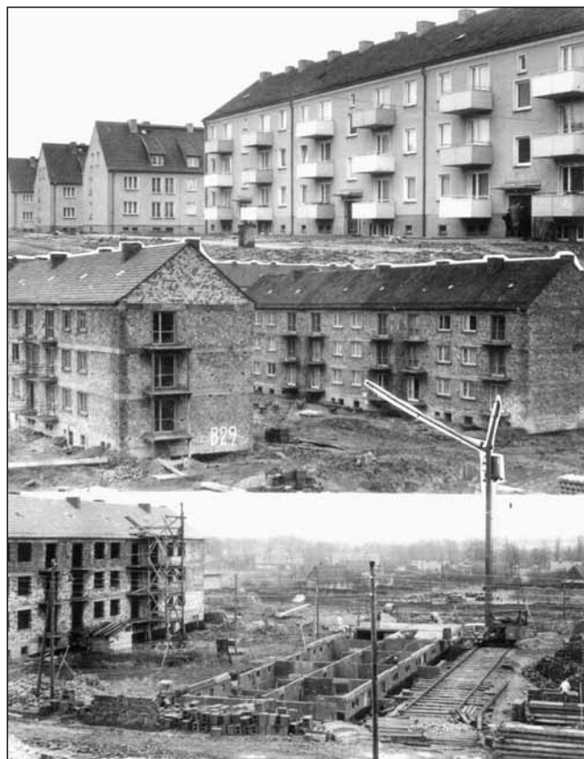
Baustelle Südstadt, 1. Bauabschnitt im Jahre 1961

Im Stadtmuseum wird gegenwärtig die neue Sonderausstellung 1958-2008. 50 Jahre Güstrower Südstadt vorbereitet. Diese Ausstellung wird ab dem 27. März 2008 zu besichtigen sein.