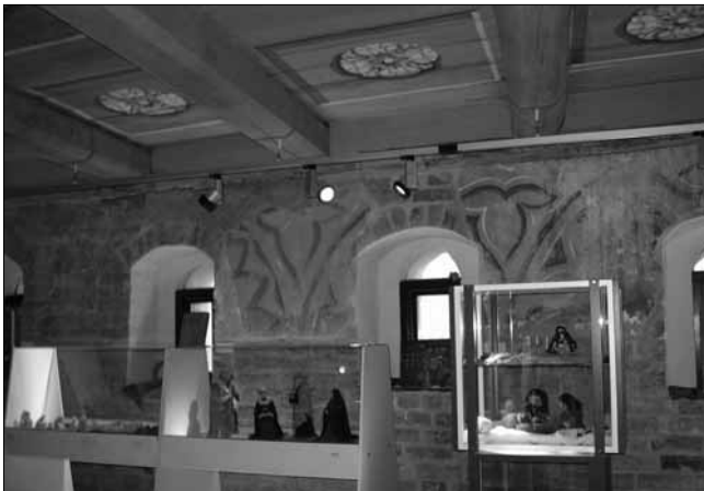
Blick in das Obergeschoss der Ausstellung mit der wunderschön restaurierten Decke